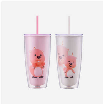
데일리 잔망루피 콜드컵

성분표시 몸체 : 트라이탄 뚜껑 : 폴리프로필렌(PP) 패킹 : 고무제(실리콘고무)