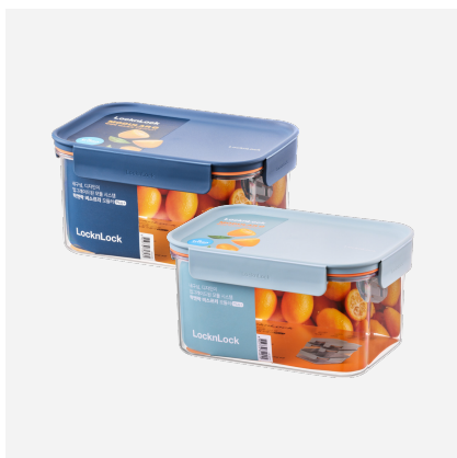
비스프리 모듈러 플러스

성분표시 몸체 : 폴리시클로헥산-1,4-디메틸렌테레프탈레이트 (PCT) 뚜껑 : 폴리프로필렌 (PP) 뚜껑패킹 : 고무제 (실리콘 고무)