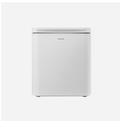
미니 김치 냉장고